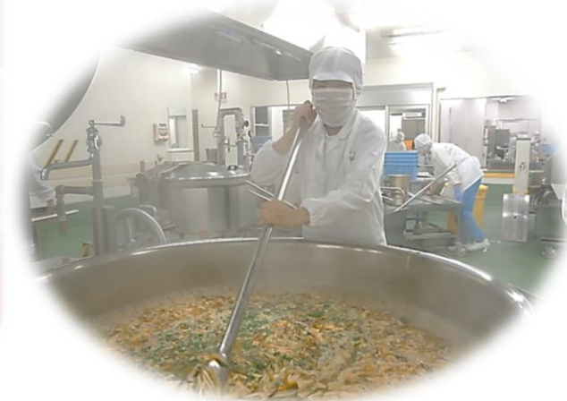
大釜を混ぜるにはコツがいります