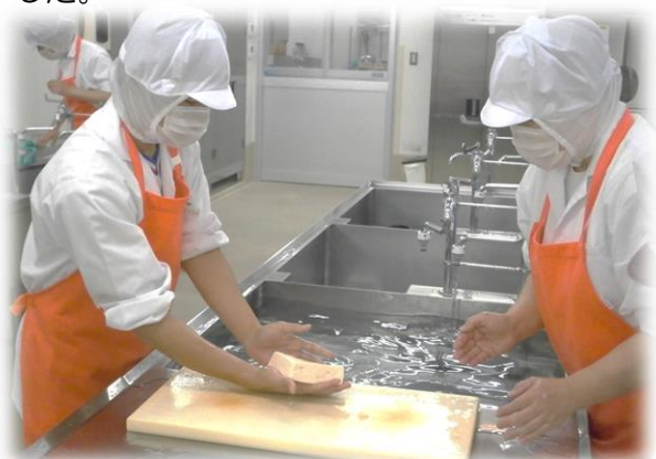
豆腐を崩さないよう慎重に

5月21日~25日に猪名川中学生6名と、5月28日~6月1日に中谷中学生3名が来られました。給食を調理し、配送車に乗って各校園に届け、食器などの洗浄作業をしました。また、国崎クリーンセンターで残菜を処分する見学や、自分たちの食事のカロリー計算をしました。