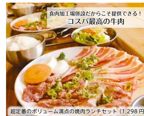
食肉加工場併設だからこそ提供できる！ コスパ最高の牛肉

まだまだ新参者ですが、地域の皆さんに親しんでもらえる笑顔いっぱいのお店づくりを目指しています。