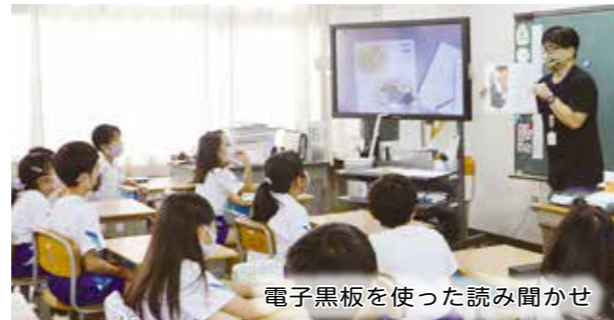
電子黒板を使った読み聞かせ