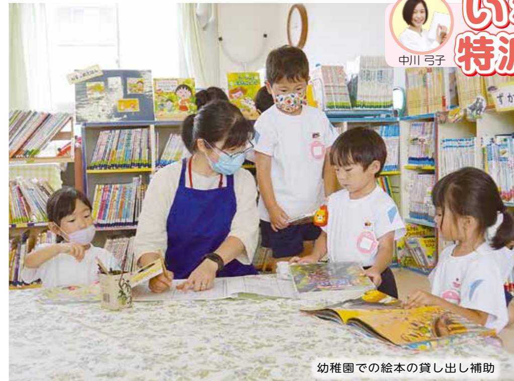
幼稚園での絵本の貸し出し補助

町では、「学校支援ボランティア」として、子どもたちの成長を支えてくださっている地域の人たちがいることをご存じですか？