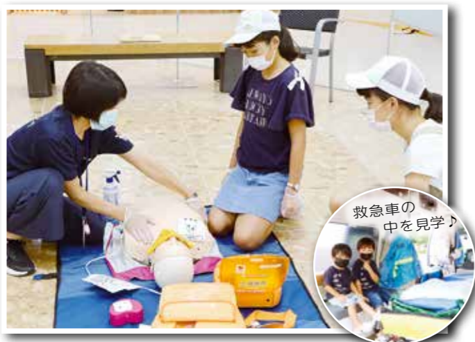
救急車の中を見学♪

▲ 9月4日、日生中央サピエで「救急フェア 2022」を開催しました。心肺蘇生法や AED の使い方などを学び、緊急時に私たちが救急現場でできることを確認できた一日となりました。