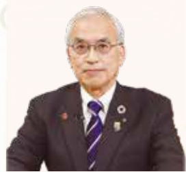
猪名川町長 岡本 信司