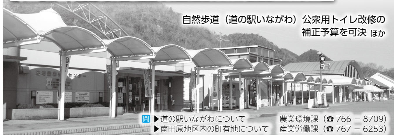
自然歩道（道の駅いながわ）公衆用トイレ改修の補正予算を可決 ほか

問 ▶道の駅いながわについて 農業環境課 (☎ 766 - 8709) ▶南田原地区内の町有地について 産業労働課 (☎ 767 - 6253)