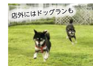
店外にはドッグランも