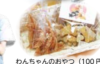
わんちゃんのおやつ (100円)