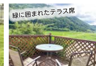
緑に囲まれたテラス席