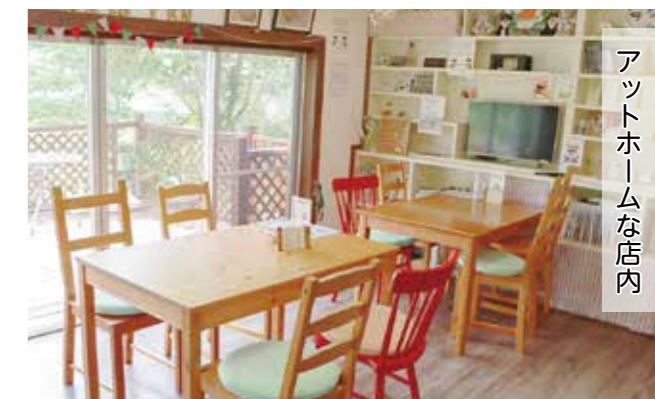
アットホームな店内

私は家で料理をしたことがほとんどありませんでしたが、60歳になってから勉強し、妻と二人三脚でメニューを開発してきました。お客さんから「美味しかった!」「また来るね!」と言ってもらえたときが何より嬉しいです。皆さんに、ゆっくりと楽しんでいただけるカフェを目指し、体が動く限り続けていきたいと思っています。わんちゃん連れの方もそうでない方も、ぜひお越しください!