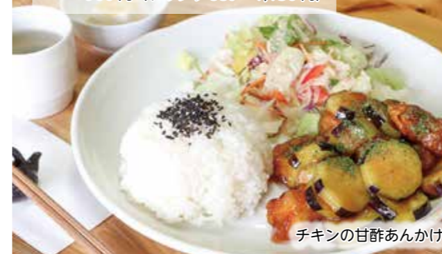
チキンの甘酢あんかけ