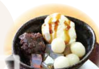
クリーム白玉あんみつ (450円)