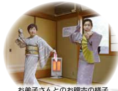
お弟子さんとお稽古の様子

社会人となり、そんなことも忘れていた頃、同僚から「会社のクラブ活動で日本舞踊を教えて欲しい」と言われたことがきっかけで、もう一度踊りに触れることになりました。昔は嫌いだった踊りも、時を経て改めて触れることで、楽しさがわかるようになり、私の中ではかけがえない趣味となりました。