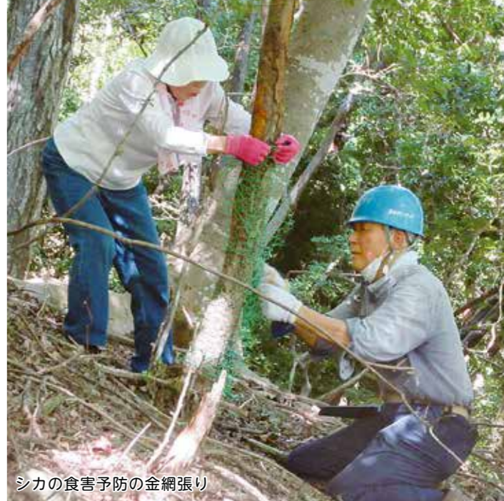
シカの食害予防の金網張り