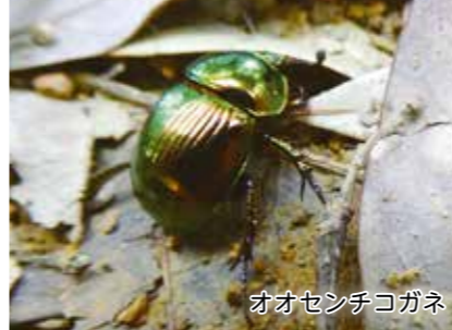
オオセンチコガネ