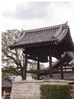
▲「現在の壬生寺鐘楼と梵鐘（嘉永年間に再建）」

ことが無くなる」といわれます。そこで広く寄付を募り、男女や位の高低、貧富に関わらず沢山の物品・金銭が寄せられました。なかでも摂津国採銅所からは16斤6両（注3）もの赤銅（注4）が納められ、大きな力になったと伝わります。鐘と鐘楼は弘長2（1262）年閏7月15日に完成しました。