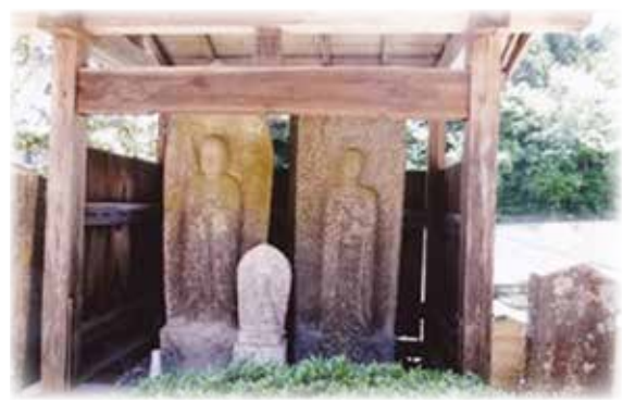
▲槻並・福祥寺境内の地藏