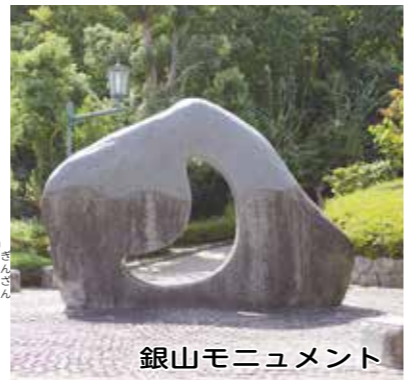
银山モニュメント

また、最奥部には「银山モニュメント」が建てられています。「银山モニュメント」は、銀のシンボルサインとして月をモチーフにしたもので、多田銀銅山の中心地であった猪名川町をあらわしています。