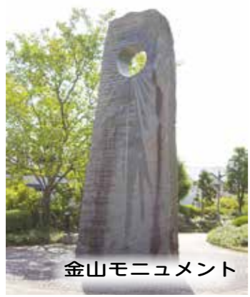
金山モニュメント

イオン猪名川と猪名川郵便局の間（白金2丁目・3丁目の境界）を入ると「四季彩の径」の散策路が続きます。中程に黒御影石で作られた、太陽をモチーフにした「金山モニュメント」があります。「金山モニュメント」は、猪名川町の姉妹都市である、オーストラリアのビクトリア州バララット市が、金山で栄えたことから、金のシンボルサインである太陽をモニュメントにしたものです。