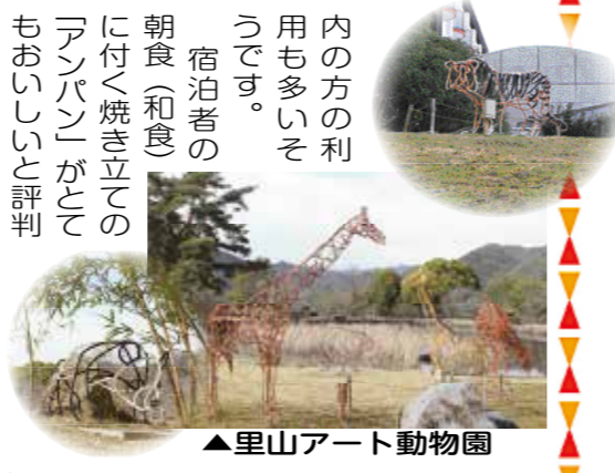
▲里山アート動物園

里山のハイキングコースは、程よいコース設定でも気持ち良く、猪名川町の北部地域を一望でき、よく見ると大野山頂の天文台まで見ることができるとは、大池の横では「里山アート動物園」と称して、メタルアートのユニークな作品が心を和ませてくれます。下の写真のほかにモノウヤカンガルーやキツネなど、動き出すことを想像すると楽しくなります。 内の方の利用も多いそうです。 宿泊者の朝食(和食)に付く焼き立ての「アンパン」がとてもおいしいと評判なのですが、宿泊者だけのお楽しみです。メープル猪名川は、「MICHLEIN2016兵庫版」に掲載された、猪名川町自慢のホテルです。ぜひ一度、泊まって朝食のアンパンも味わってみたいですね。 日々の喧嘩を忘れ、澄んだ空気の中でリフレッシュしてみたいかがでしょうか。