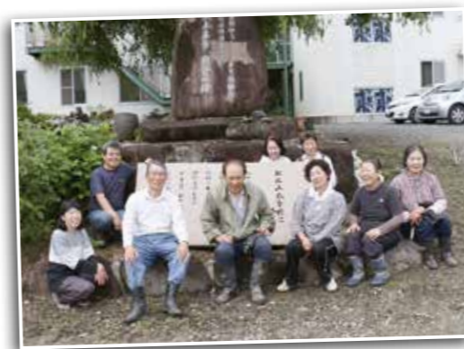
地域の清掃活動「頑張ってます!!」

先日、福祉委員との交流会があったのですが、その時嬉しいことがありました。福祉委員に新しくなられた方が「なんとなく引き受けたけど、地区の民生委員さんいろいろな教えてもらっている間に、本気で取り組まなければと思うようになった」と言われました。一人でも多くの方が福祉への認識を高めてくださることで、誰もが安心して暮らせる地域づくりの大きな力になると思います。平成26年4月、柏梨田に児童養護施設「いながわ子供の家」が新設されました。私たち委員会も地域の一員として、よりよい関わり方を続けたいと話し合いを進めています。 私は今年、18年間続けた民生・児童委員を定年のため退任します。本当にたくさんのおいしき出会いとよい経験をさせていただいたと感謝しています。続けることの大切さと、続けられたことへのありがたさを感じているところです。