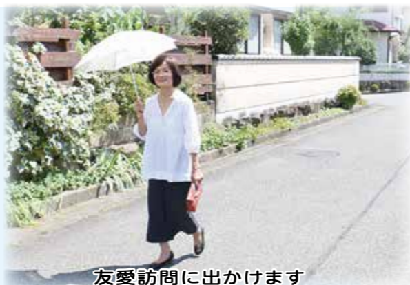
友愛訪問に出かけます