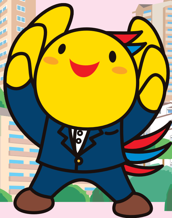
フェニックスサポーター はばタン