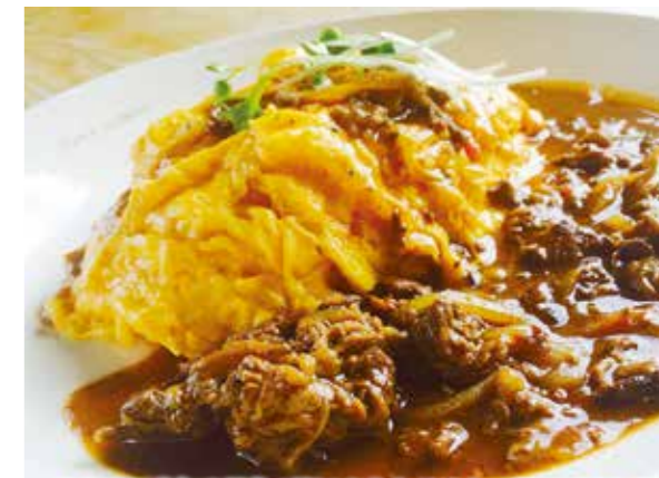
当店1番人気!鉄人の卵のふわとろオムハヤシ(950円)

国指定重要文化財「戸隠神社」の麓にカフェをオープンし、25年目になります。山の中でも人が集まりやすい場所を作りたいという思いから「山の駅」という名前をつけました。当店は2階がカフェ、1階はスポーツステーションとして営業中です。カフェで田舎のちょっとのんびりした贅沢な時間を味わいたい人や自然の中でスポーツを楽しみたい人など、訪れる人に猪名川町の良さや雰囲気を知ってもらいたくて、いろいろ工夫しています。これからも里山の自然などを活かし、「猪名川町らしさを感じ、楽しんでもらえるお店」として、皆さんが集い、人や自然が交流できる場所にしていきたいです。