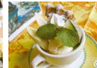
③淹れたてコーヒーと一緒にパフェなどのデザートも