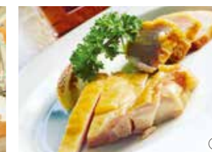
②工夫を重ねて完成させた自慢の燻製ベーコン