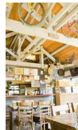
①店内は温かみのある木の空間(全24席)