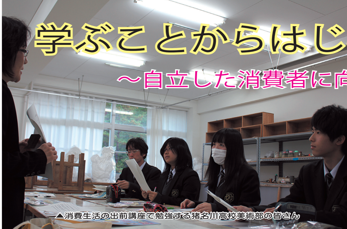
▲消費生活の出前講座で勉強する猪名川高校美術部の皆さん

日常の消費生活についての相談、商品やサービスに関するさまざまな疑問や苦情、トラブルについて、専門の消費生活相談員が相談に応じ、問題解決のお手伝いをしています。