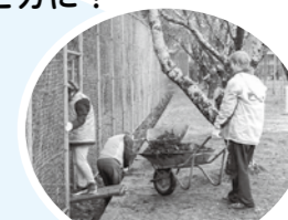
松尾台小学校の清掃隊