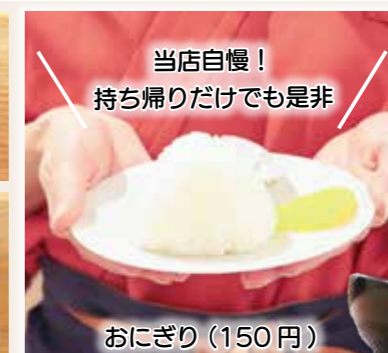
当店自慢！ 持ち帰りだけでも是非