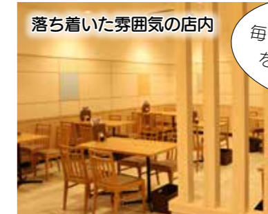
落ち着いた雰囲気店内