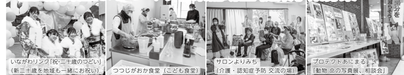
いながわリンク「祝・二十歳のつどい」 （新二十歳を地域も一緒に祝い）