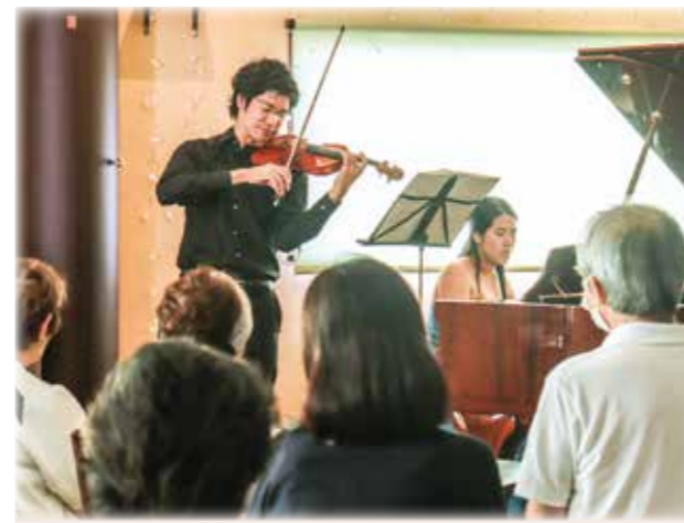
間近で楽しむ カフェ・コンサート

提供したいのは「良い時間」。珈琲の香りと音楽を楽しめる、男性も女性も気軽に一人で入れる、そんな心地よい居場所を作りたいとカフェをオープンし、4月で11周年を迎えます。