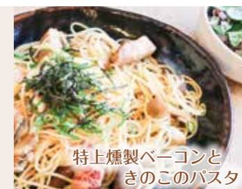
特上燻製ベーコンときのこのパスタ