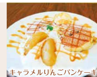
キャラメルりんごパンケーキ