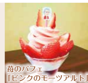
苺のパフェ 「ピンクのモーツァルト」