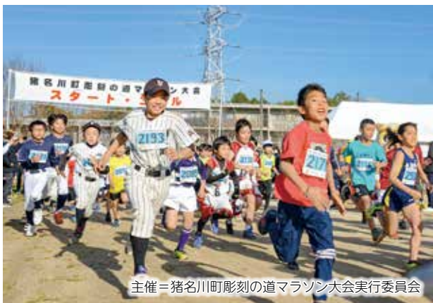
主催=猪名川町彫刻の道マラソン大会実行委員会

▲松尾台小学校周辺で「第51回猪名川町彫刻の道マラソン大会・第38回小学生駅伝大会」を開催。快晴の下、総勢636人のランナーが競い合いました。