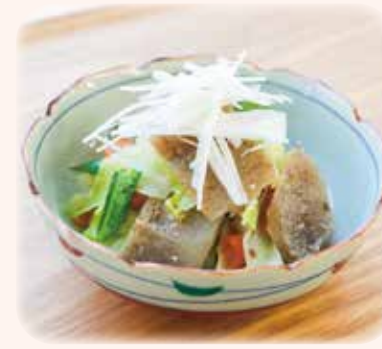
(エネルギー 86kcal、食塩相当量 0.8g)

こんにゃくは食物繊維が豊富で、胃腸の動きを良くし、便通を整えることから、「体の砂払い」や「胃腸のほうき」などと昔から言われてきました。また、低カロリーのため、エネルギーを気にせず食物繊維を補給できる嬉しい食材でもあります。