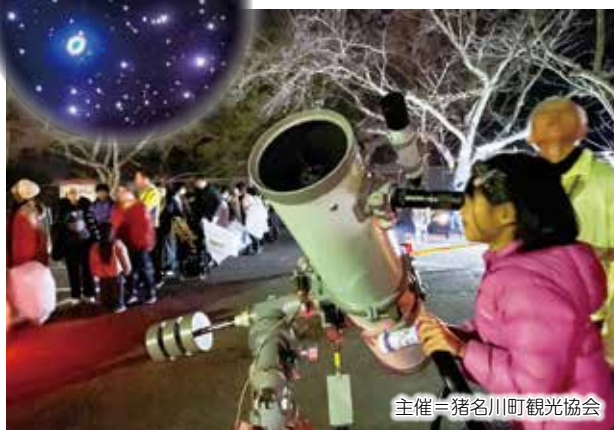
主催=猪名川町観光協会

▲12月2・10・17日に町内各所で「2023 いながわ星旅」を開催。星が綺麗なこの町を週末ごとに旅して、毎回異なるイベントなどと一緒に冬の星空を楽しみました♪