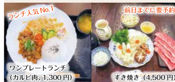
ワンプレートランチ（カルビ肉、1,300円） すき焼き（4,500円）

全国に約300以上もある黒毛和種ブランド牛（銘柄牛）の中でも最上位クラスの佐賀牛。部位ごとに異なる美味しい食べ方を様々なメニューでお楽しみいただけます♪