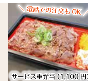
サービス重弁当（1,100円）