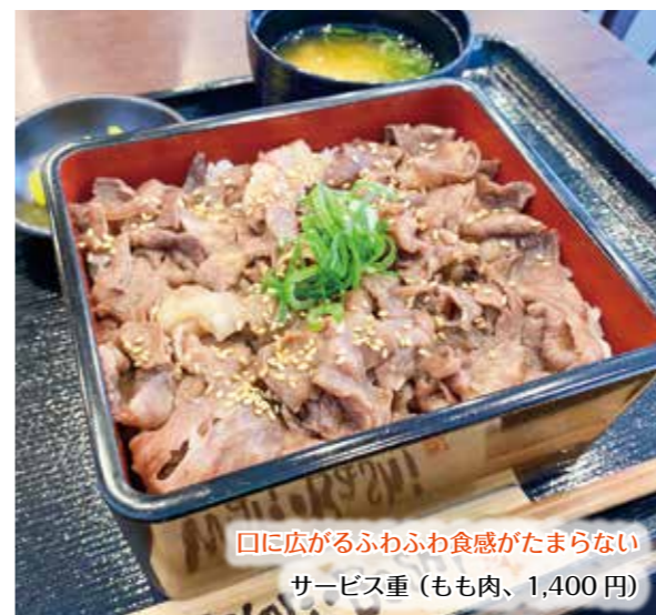
口に広がるふわふわ食感がたまらない サービス重（もも肉、1,400円）

師亭は、町の玄関口、日生中央駅前に佐賀牛専門店としてオープンし、この2月で5年を迎えました。「なぜ佐賀牛なの？」とよく聞かれますが、実家が佐賀県嬉野市で、そこで食べた美味しい牛肉を皆さんにも味わっていただきたいという思いから、脱サラして開業しました。A5ランクの佐賀牛を牧場より直接仕入れ、新鮮で柔らかいお肉をフランクにかつリーズナブルに楽しんでいただけるよう、工夫しながら営業をしています。