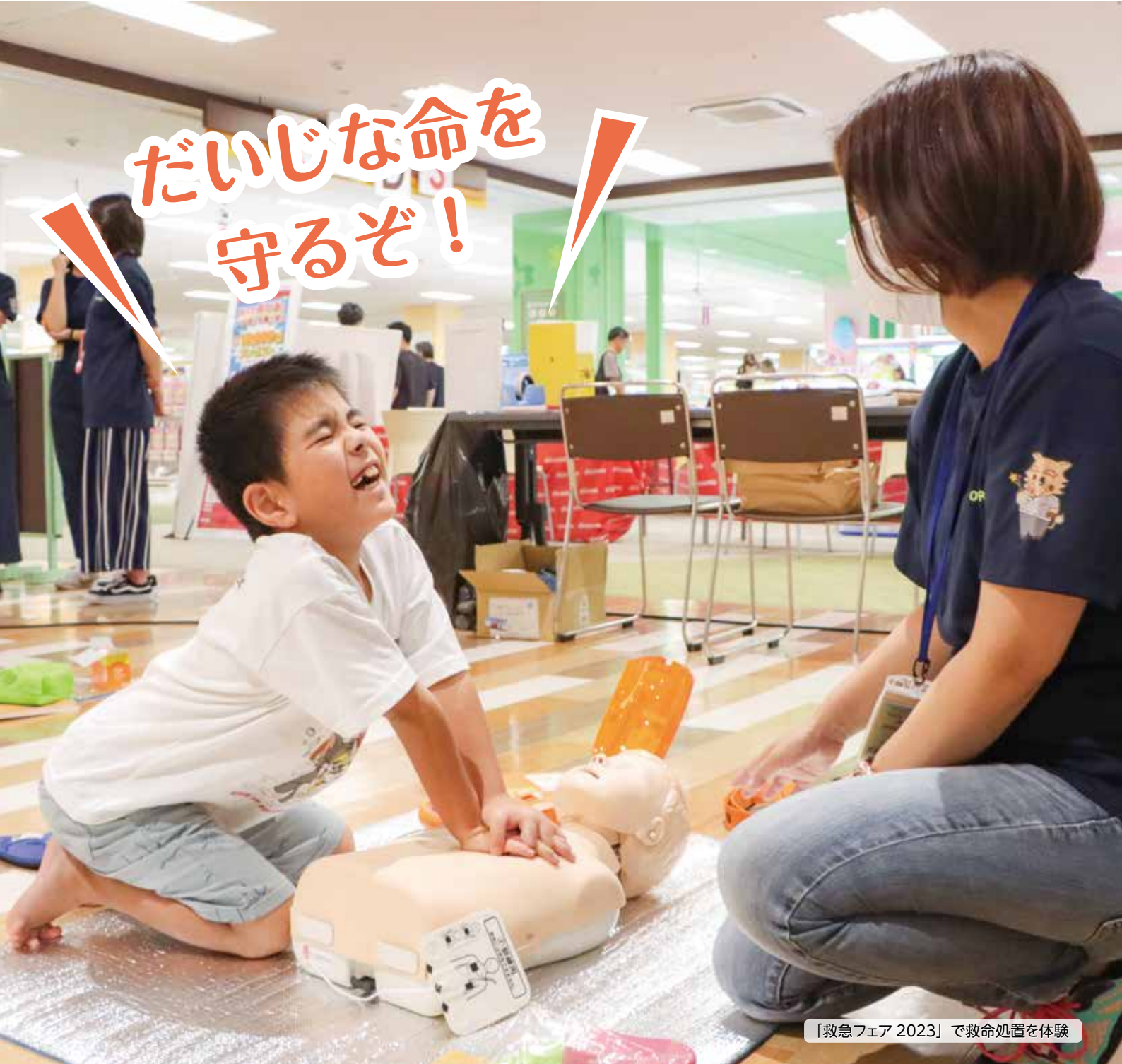
「救急フェア2023」で救命処置を体験