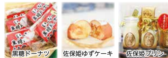
道の駅いながわで人気のお土産、デザート販売中♪