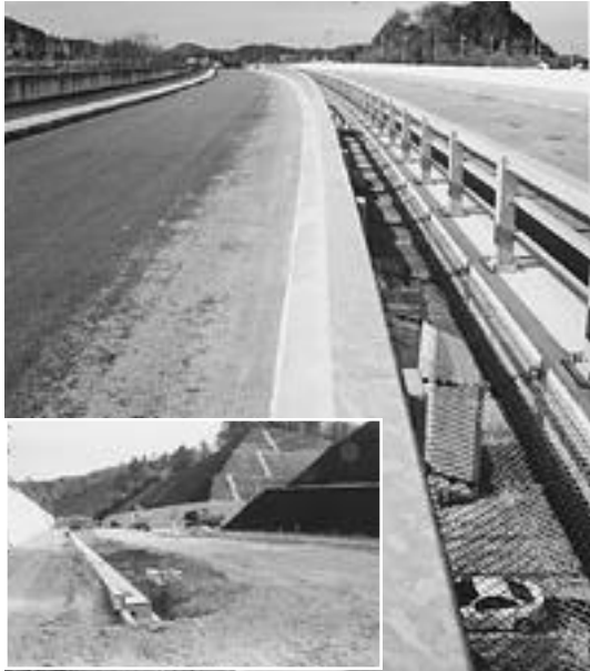
現在行き止まりとなっているつつじが丘から先の工事の様子(肝川大橋以南)