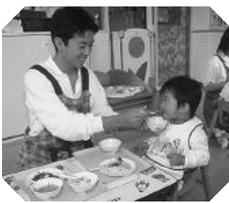
園児に食事を与える保育士

また、育児休業制度・介護休暇の延長の導入、放課後児童を預かる学童保育の実施、保育園における保育時間延長や一時保育の実施で、女性が働き続けることのできる環境整備に努めています。