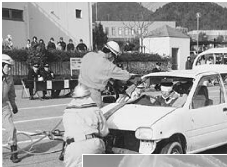
今年1年の安全を願い 消防出初式開催

1月25日から31日までの6日間、ジャスコ猪名川店で、町内中学校3校による「合同作品展」が開催されました。この作品展は今年で4回目を迎え、日頃、美術や書写の授業で制作した作品や、夏休みに時間をかけて調査した理科の研究レポート、美術部員による作品などさまざまな力作が発表されました。