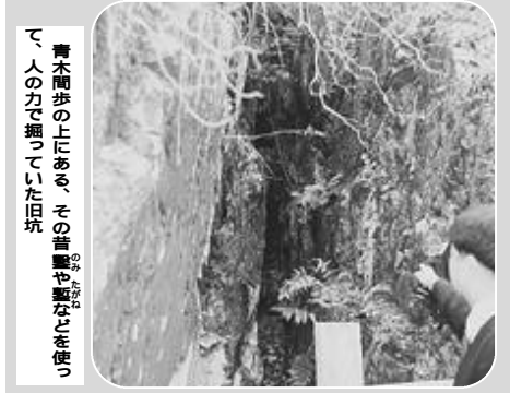
青木間歩の上にある、その昔驚や驚などを使って人の力で掘っていた旧坑