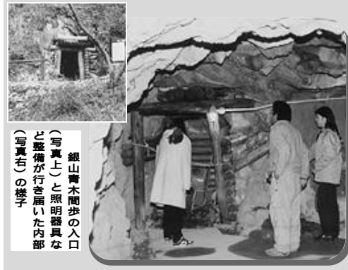
青木間歩整備の概要

銀山青木間歩(通称「青木間歩」)の名前の由来は、薬用植物として利用されるアオキがその周辺に繁茂していたことからその名が付いたという説もあります。 その昔、人が驚や驚などを使って少すつづつ掘っていた旧坑と、日本鉱業昭和29年から48年まで多田銀山にて採掘が機械を使用して掘られた新坑とが比較してみてきた。 また、新坑の中に入ると、今でも鉱脈の筋を観察することができ、教育委員会では児童生徒の学習の教材提供を目的として平成12年から平成13年11月30日まで2カ年連続事業で、青木間歩を整備しました。これにより坑道内へ安全に入れることになり、新旧坑道の比較もしやすくなりました。金山彦神社から直接青木間歩へつながる散策路も整備していますので、銀山地区のハイキングの際には、一度見学してみたいと思います。 お問い合わせは、社会教育課(67・2600)へ。