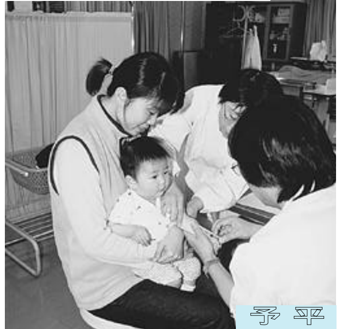
保健センターでの予防接種の様子 (結核ツベルクリン反応)