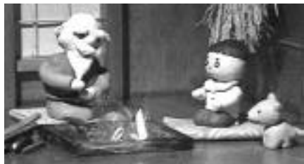
民話の導入部分では、クレイアニメでおじいちゃんと孫が出演します

1階のレクチャー室は30人程度が収容でき、コンピュータ制御のデジタルプラネタリウムにより、当日はもちろん前後100年の日付けと場所を指定して、直径6mのド