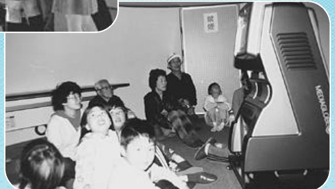
1階のレクチャー室(右)と2階の観測室(上)

また、口径10cmと15cmの望遠鏡も併設されており、見る物によってはこの望遠鏡の方が適している場合があり、天気の良い昼間には、太陽の黒点や金星をみる事が出来ます。