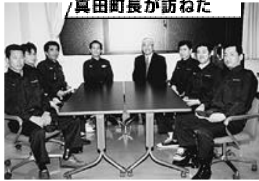
真田町長が訪ねた