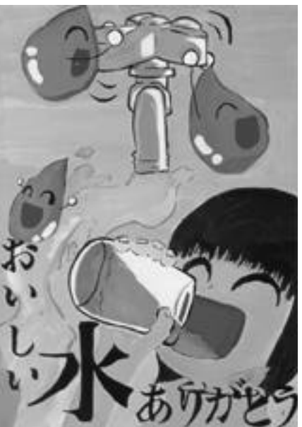
第43回水道週間特選ポスター