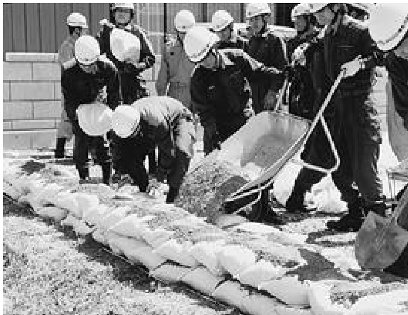
災害時に備え、水防工法訓練を行う消防職員

ホームページアドレス (URL) http://www.town.inagawa.hyogo.jp 電子メールアドレス koho@town.inagawa.hyogo.jp