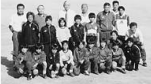
試合のあい間に、町長を囲み指導員・選手のみなさんと記念撮影