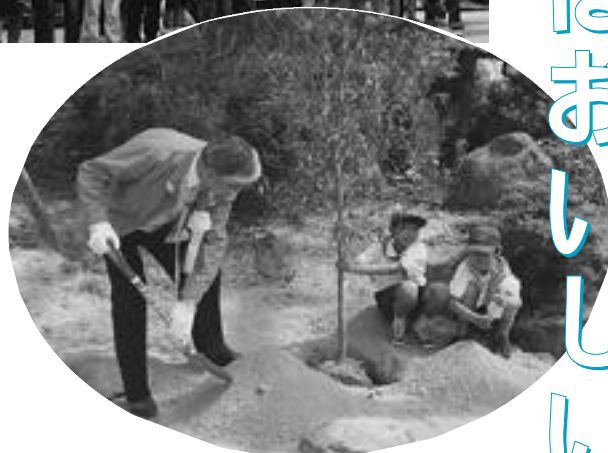
真田町長と緑の少年団の植樹

初夏の風がさわやかな5月26日、大野アルプスランドで「ひょうご森の祭典2002」が開催されました。これは、人と森との共生をめざす「ひょうご豊かな森づくり構想」のひとつとして、県下の自治体で毎年開催されているものです。緑豊かな自然の恵みに触れることで、自然の大切さを再認識しようと今年の本町において「清流猪名川の森づくり」をテーマに開催されました。