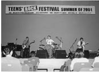
昨年のロックフェスティバル

とき 8月3日(土)午後6時開演 ところ 文化体育館(イナホール) 入場料 無料 出演数 6組 問合せ 生涯学習課(67-2600)