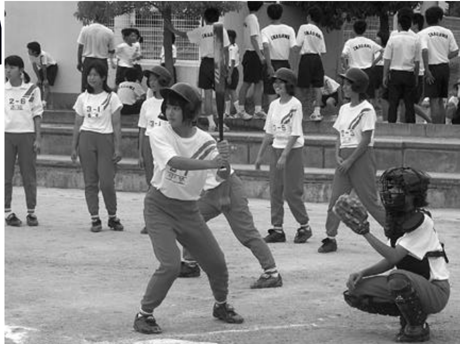
部活動に励む猪名川中学校の生徒達