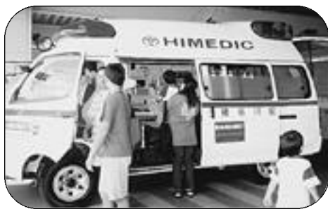
昨年の救急フェアで救急車を見学する参加者