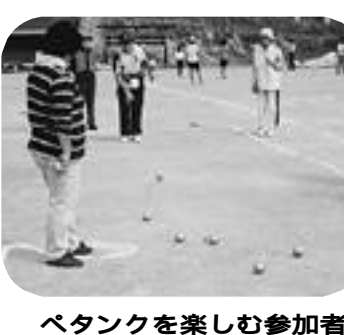
バタンクを楽しむ参加者

スポーツの秋、みんなでレクリエーションスポーツを楽しみましょう。とき 10月14日(祝) ところ 猪名川町スポーツランドおよび勤労者総合センター