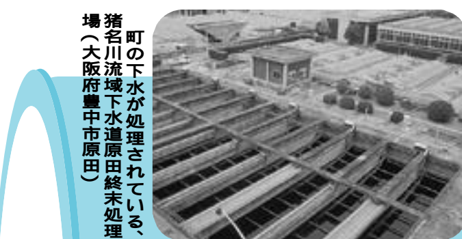
町の下水が処理されている、猪名川流域下水道原田終末処理場（大阪府豊中市原田）

猪名川の水質は、生活排水を中心とした汚染により悪化傾向にありましたが、近年の下水道整備とともに改善されつつあります。 「下水道の日」を機に清流猪名川を取り戻すためにも、私たちが果たさなければならないことについて、今一度考えてみましょう。 皆さんは、町の下水道普及率（町内で下水道の利用が可能な人口を町内全体の人口で割ったもの）をご存じですか。平成14年3月末時点で97・9%。昨年の同時期と比べ2・5%上昇しています。 一方、水洗化率（下水道を利用 いただいたいる人口を下水道の利用が可能な人口で割ったもの）は、本年3月末時点で90・2%。昨年の同時期と比べ0・1%上昇しています。しかし、下水道普及率と水洗化率の間には開きがあります。これは、下水道が利用いただけない状態が未だ利用いただけない方がおられることを示しています。法律では「下水道が利用できる状態になってから3年以内に下水道へ接続しなければならぬ」と定められていますが、町では、下水道への接続にかかる支援措置として、「水洗便所等改造資金融資制度」を用意しています。積極的にご利用ください。 なお、下水道への接続工事については、町の排水設備指定工事店へご相談のうえ申込みください。 問い合わせは、上下水道部（66・8703）へ。 「下水道の点検に来ました。」というインターフォン越しの呼びかけに、大半の人が「町役場からの訪問」と勘違いされるような「下水道管の清掃業者」による営業活動が多発しています。 町の上下水道部にも「町が点検をさせているのか？」といった問い合わせが多く寄せられました。町では皆さんから修理依頼がない限り、業者を紹介したり派遣するようなことは一切ありません。訪 問した業者に清掃を依頼される場合は、先に見積りを取られるなど、十分な確認をされたうえで依頼されることをお勧めします。 半年に一度は、蓋を開けて点検しましょう 「ご自宅の周囲に設置してある下水道の樹の蓋を開けたことがありますか？長年の使用により樹の底に穴が開いて水漏れしたり、時には、油のかたまりがこびりついたり木の根が入り込んで水の流れを妨げていることがあります。容易に補修ができないときや万一の故障などでお困りのときは、町の排水設備指定工事店が猪名川管工業協同組合（66・3305）または、町役場上下水道部（66・8703）へ連絡ください。