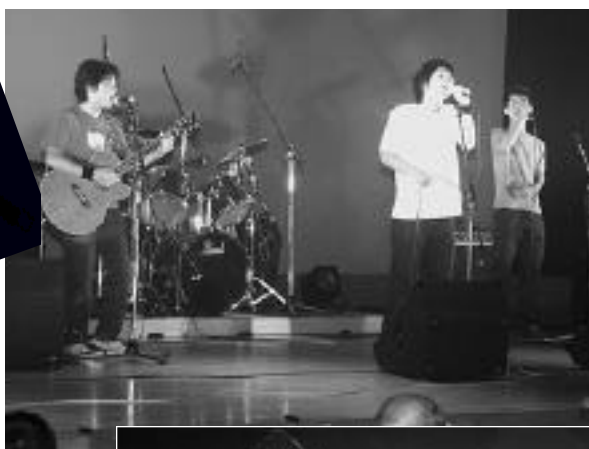
真夏の夜は音楽鑑賞を楽しもう