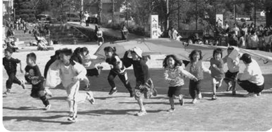
大人から子供まで、いっしょに楽しんだ昨年の楊津小学校区住民運動会

秋空の下、各小学校区において住民運動会が開催されます。家族そろってご参加ください。なお、阿古谷小学校区の運動会は9月に終了しました。