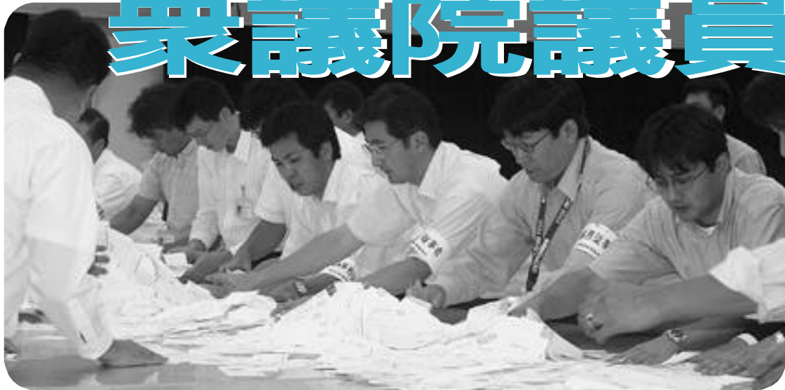
選挙事務従事者による開票の様子

解散による衆議院議員総選挙は、本日10月28日に公示され、投票日は、11月9日(日)です。 この選挙は、前回の衆議院議員総選挙と同様の小選挙区比例代表並立制による選挙で、定数は小選挙区選出議員300人(兵庫5区は1人)、比例代表選出議員180人(近畿地方での比例代表選出議員定数は29人)の合計480人となっています。 また、この選挙は、私たちの暮らしやあなたの意見を国政に反映させるための議員を選ぶ大切な選挙です。各候補者の経歴や抱負などを記載した選挙公報をよく確認し、みんな揃って投票しましょう。