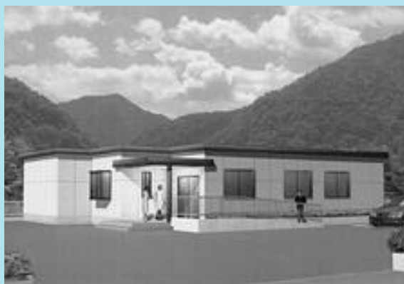
杉生診療所建設工事完成予想図

県道島能勢線の改良に伴い、移築されることになった「杉生診療所」が3月3日（月）に、現在の診療所の南側にオープンします。この診療所は、（町が建設して今井病院に貸与し、診療業務は自主運営）町北部における地域医療を支えている重要な施設です。建物は受診された人が利用しやすい設計としており、屋根には太陽光発電装置をつけ、環境にも配慮した建物として整備しています。