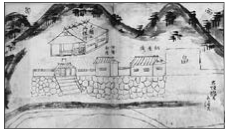
明治初期の絵図(上)

出願手続 入学願書を2月17日～同28日に阪神シニアカレッジ事務局へ郵送(当日消印有効) 入学案内・願書配布先 阪神シニアカレッジ事務局、阪神北県民局、町健康福祉課 入学者決定 応募多数の場合は抽選 申込・問合せ 同事務局(0797-85-8880/〒665-0845宝塚市栄町2-1-2ソリオ2(8F))