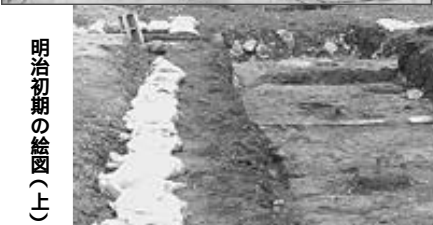
明治初期の絵図(上) 現在発掘中の代官所跡(右)