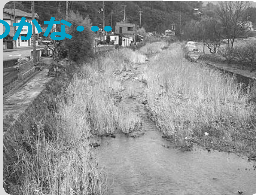
葦などの水草が生い茂り、水量も減少した猪名川