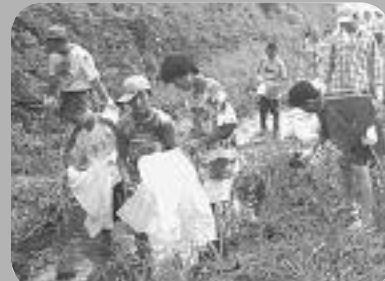
毎年、商工会青年部が実施しているラブ・リバー INAGAWAの河川清掃活動

今後も、清流猪名川を取り戻すための新たな事業を順次展開していきます。住民の皆さんからの意見やアイデアを、お待ちしております。 問い合わせは、企画政策課（766-8711）へ。