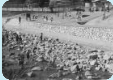
昨年に完成した親水護岸のある大島であい公園