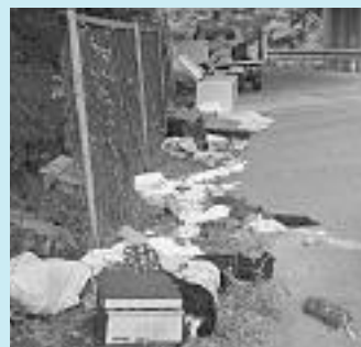
民田地区大路次川沿の不法投棄