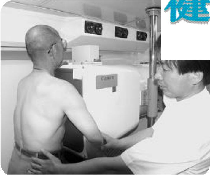
六瀬住民センターで行われた、町ぐるみ健診(胸部X線直接撮影)の様子