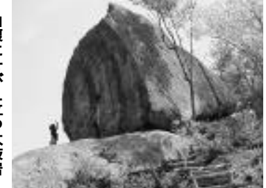
山腹にそびえ立つ太鼓岩

見学場所 いちごのハウス栽培の見学「果楽土(カラット)」～道の駅いながわ～ 杉生「景福寺」～奥猪名健康の郷(昼食)～大野山のあじさい～太鼓岩