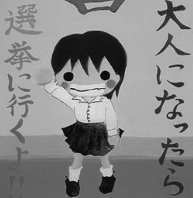
明るい選挙啓発ポスター文部科学大臣・総務大臣賞 作品 = 秋田県 戸田圭子さん(入選時中学2年生)