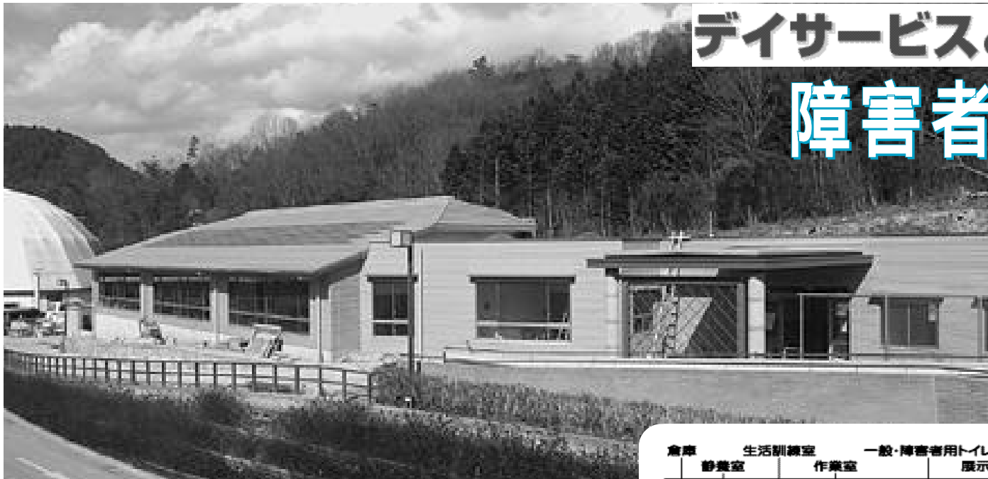
4月のオープンに向けて、最終段階の工事が進められている障害者福祉センター