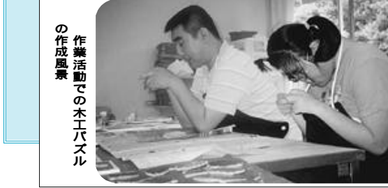
作業活動での木工バスの作成風景

自立を図ることや社会参加を促す 小規模通所授産事業 小規模通所授産事業では、個別支援計画の作成、自立生活教室、作業活動、文化・レクリエーション、生活相談、送迎サービス、給食サービス、介助サービスと健康診断の9事業を実施します。 小規模通所授産事業の対象者は、町内に在住される18歳以上の方で、身体障害者手帳の交付を受けた方が利用することができま