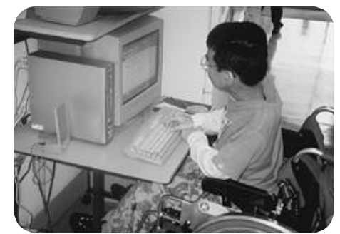
自立生活教室でのパソコン操作の学習風景

障害者デイサービス事業の内容 送迎サービス リフトバスにより車椅子利用者などの送迎を行います。 健康チェック 利用者の健康状態の確認や相談を行います。 機能訓練 日常生活の動作、歩行や家事訓練を行います。 生活相談・指導 日常生活での不安や心配ごとなどの相談・指導を行います。 レクリエーション 観覧会、運動会、クリスマスなど季節に合わせたふれあい行事を行います。 創作活動 手芸、工作、絵画、書道、陶芸や園芸などの技術援助と作業を行います。 自立生活訓練 調理、パソコンの操作や生活マナーなどの訓練。また図書館への外出やマイケアプランづくりを目指した学習も行います。 介護方法の相談・指導 更衣、排せつなどの身体介護の相談を行います。 給食サービス 利用者に食事の提供を行います。 入浴サービス 利用者の介護浴を行います。