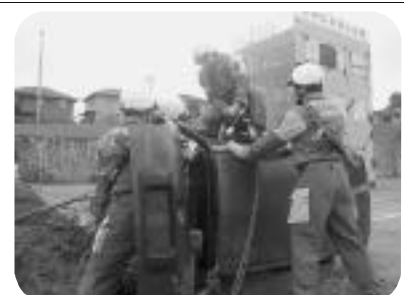
総合防災訓練を実施