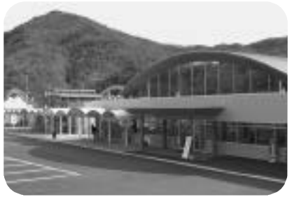
拡張整備された「道の駅いながわ」