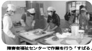
障害者福祉センターで作業を行う「すばる」