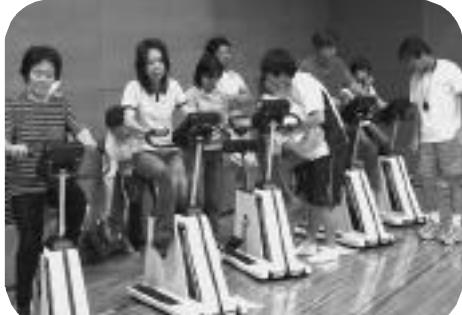
エアロバイクでの体力測定【大ホール】