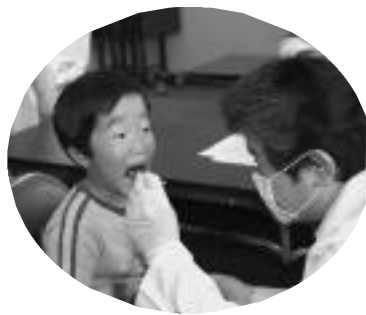
ブラッシング指導【会議室】