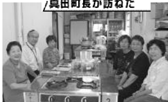
和気あいあいと語り合うグループの皆さんと真田町長

いなご郷グループは、会員13人で町内で生産された野菜などを使った特産品を作り商品化されています。安全・安心な商品として「道の駅いなご」などで販売し、地産地消にもつなげています。 町長 皆さんの活動は、魅力あるまちづくりの一つである地産地消につながっています。今までの苦労話を聞かせてください。 副会長 安心して買ってもらえるため、ほとんど手作業でつくっています。味噌も失敗の連続でしたが、やっと商品になりました。「この味噌を食べたら、他の物は食べられない」と言っていたと嬉しくなります。 町長 好まれる商品への調査や研究はされているのですか。 会員 県下の特産物はすべて見ました。今、お弁当の話がありますが、いかに日持ちさせるかを検討中です。 会員 旅行に行っても、自分達にとって参考