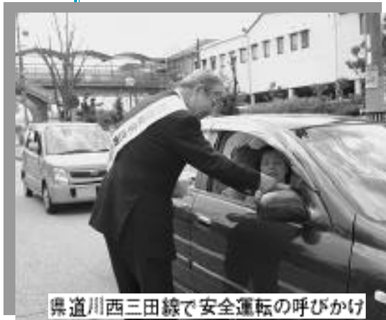
県道川西三田線で安全運転の呼びかけ