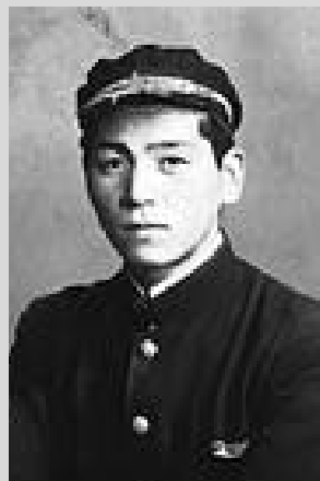
高校時代の真田町長

怖かったもの 父親です。近所のおじさん達も怖かったですね。先生に怒られたことより、それを父親に知られるほうが怖かったですよ。