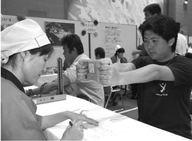
昨年の健康福祉まつりで体脂肪測定を行う参加者

人の動き 人口：31,155 (+35) 男：15,063 (+3) 女：16,092 (+32) 世帯：10,599 (+30) (平成18年5月1日現在)