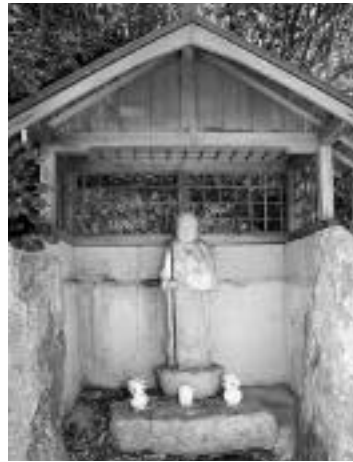
掛ヶ坂地藏(北田原地区)

いながわ 歴史ウォーク ④ 道の辺のお地藏様 地藏菩薩は、釈迦の入滅後、弥勒菩薩が出現するまでの間、無仏世界にあって一切の生物を救済するといわれる菩薩です。